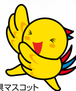
「兵庫県マスコット はばタン」