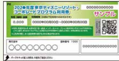
コーポレートプログラム利用券

利用券に記載されている利用(補助)金額分が、パークチケット価格や ディズニーホテル宿泊費から差し引かれる形でご利用できます。