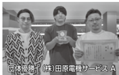
団体優勝 (株)田原電機サービス A