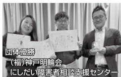
団体優勝 (福)神戸明輪会 にしだい障害者相談支援センター