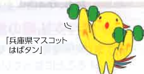
「兵庫県マスコット はばタン」