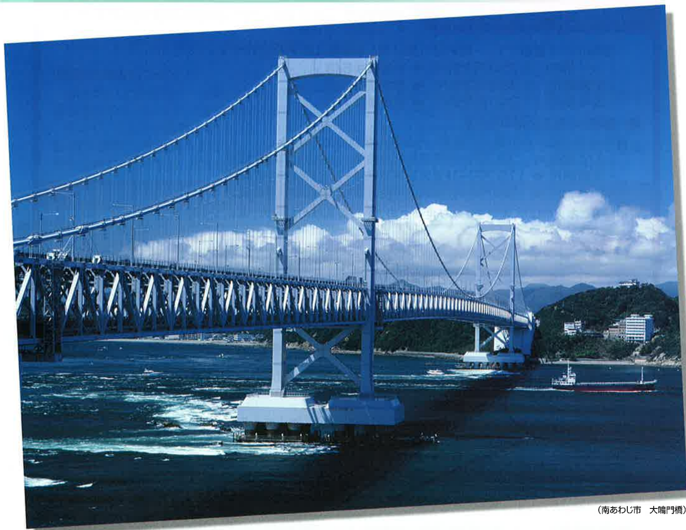
(南あわじ市 大鳴門橋)