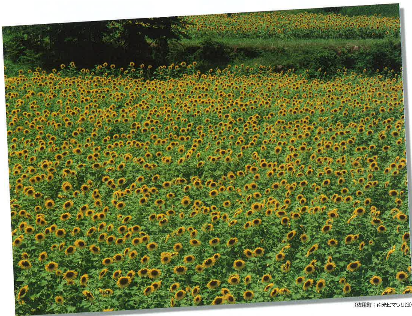
(佐用町：南光ヒマワリ畑)