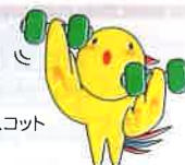
「兵庫県マスコット はばタン」