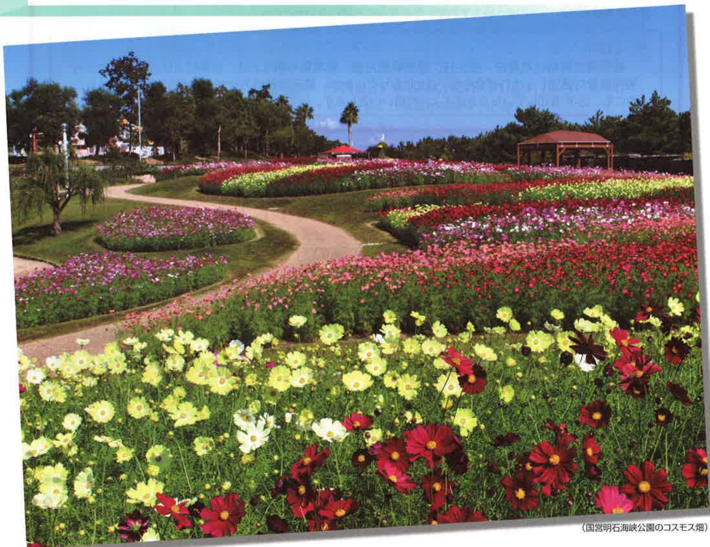
(国営明石海峡公園のコスモス畑)