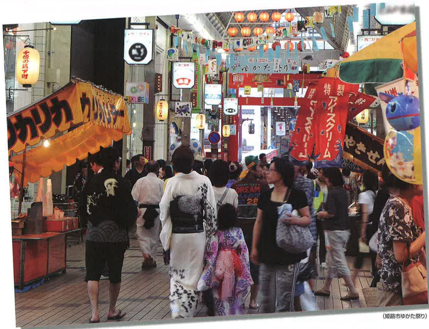
(姫路市ゆかた祭り)