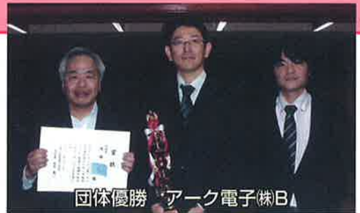
団体優勝 アーク電子(株)B