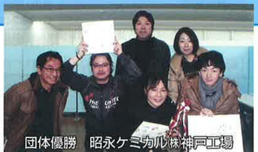
団体優勝 昭永ケミカル(株)神戸工場