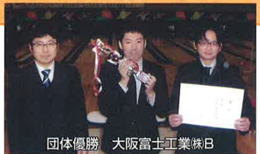
団体優勝 大阪富士工業(株)B