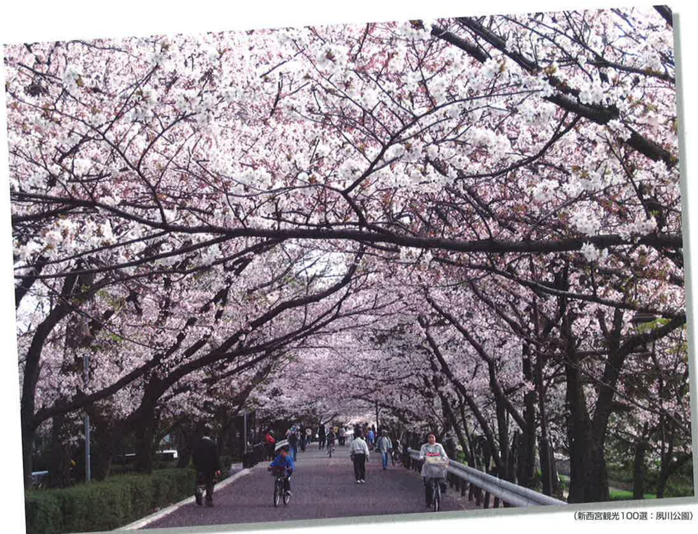
(新西宮観光100選：夙川公園)