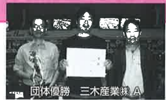
団体優勝 三木産業株 A