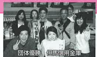
団体優勝 但馬信用金庫