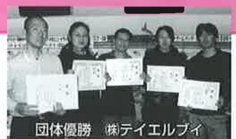
団体優勝 (株)ティエルバイ