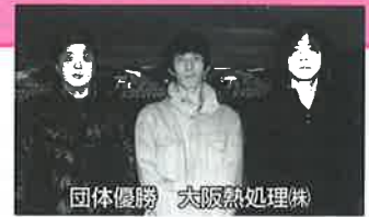
団体優勝 大阪熱処理株