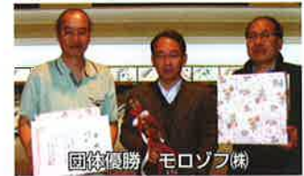
団体優勝 モロゾフ(株)