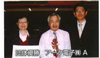
団体優勝 アーク電子(株) A