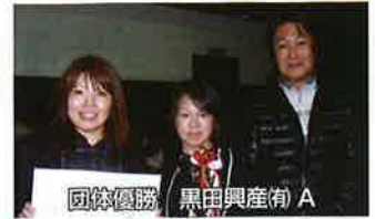
団体優勝 黒田興産(有) A