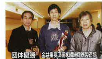
団体優勝 金井重要工業(株)繊維機器製造所