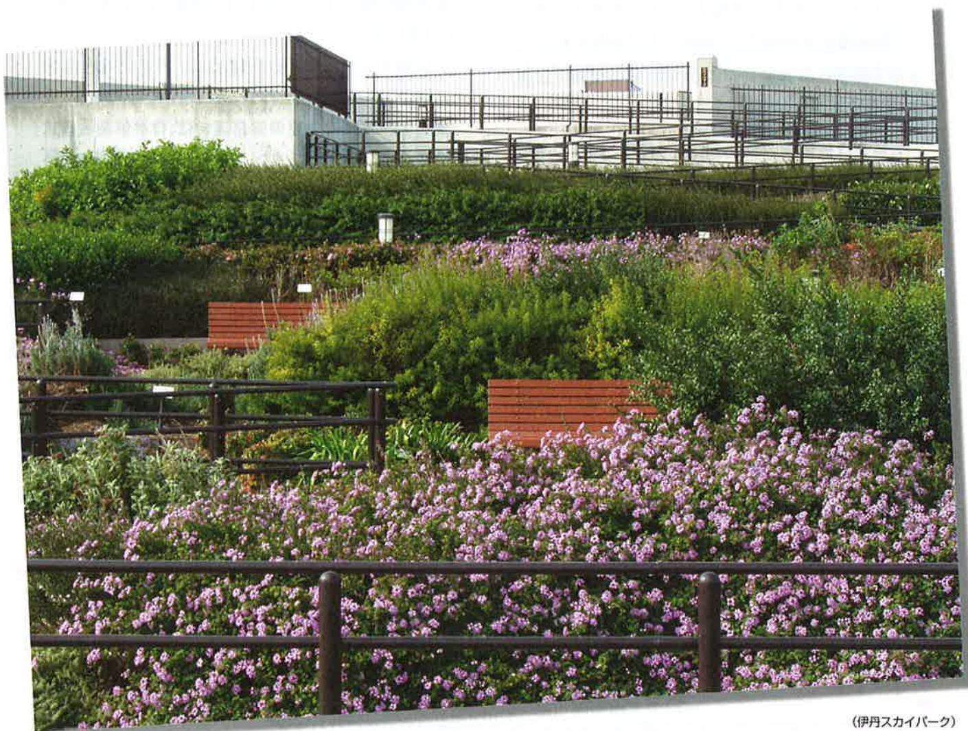
(伊丹スカイパーク)