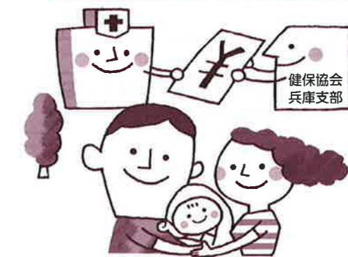
医療機関等に直接支払われる