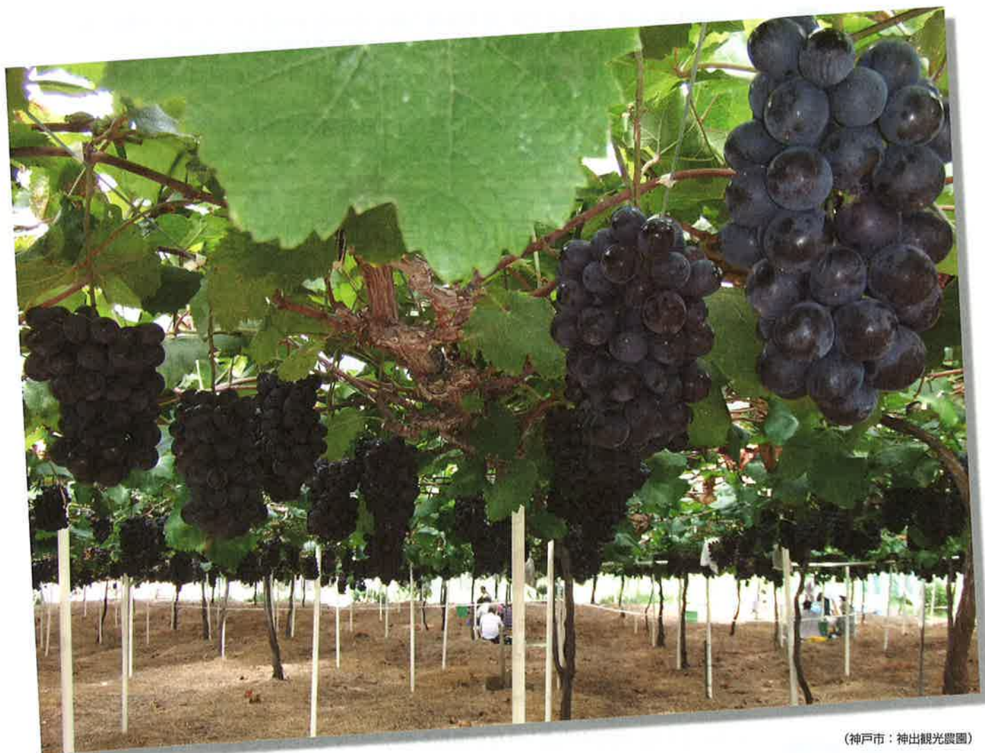
(神戸市：神出観光農園)