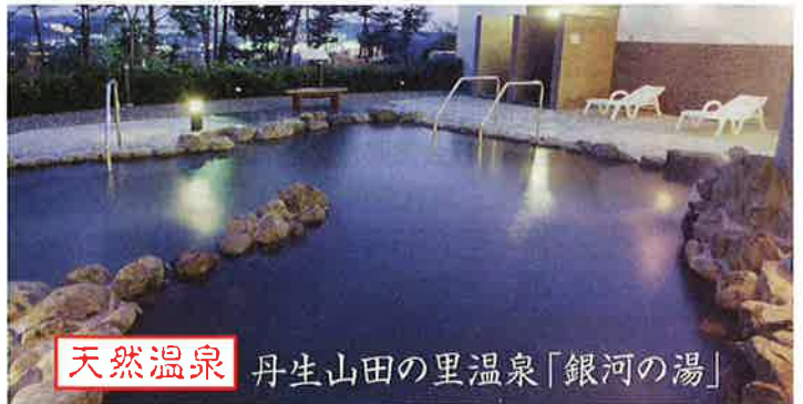
天然温泉 丹生山田の里温泉「銀河の湯」

濃い緑に囲まれたホテルの周辺には自然が多く、スポーツで爽やかな汗を流すにはピッタリのロケーション。異国情緒たっぷりの神戸の街を散策するのも便利です。また、六甲山まで足をのぼして1000万ドルの夜景を見るのも、心に残る思い出になるでしょう。